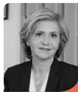
VALÉRIE PÉCRESSÉ Présidente de la Région Île-de-France

Nous vous souhaitons donc trois jours vibrants d'émotion et de passion. Et comme le dit un des créateurs de la série Baron Noir , « nous avons besoin de fiction, mais le réel est souvent déjà extraordinaire à raconter ». En étant persuadés que c'est ce que visent les acteurs de la filière, nous vous souhaitons un bon festival !